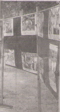
ement of Tamil Nadu and Public Relations

ay consumers view consume packaged The endeavour d be tobridge the riential gap between bakery cakes and aged cakes through unique offerings."